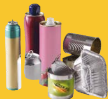
Canettes, bidons, boîtes, barquettes en métal