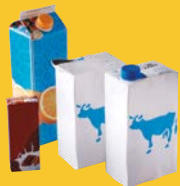
Cartons, cartonnets, briques