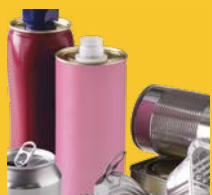
Canettes, bidons, boîtes, barquettes en métal.