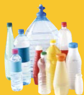
Bouteilles et flacons en plastique.