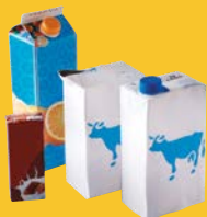
Cartons, cartonnettes, briques