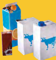
Cartons, cartonnettes, briques