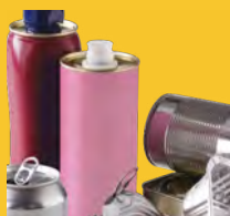
Canettes, bidons, boîtes, barquettes en métal