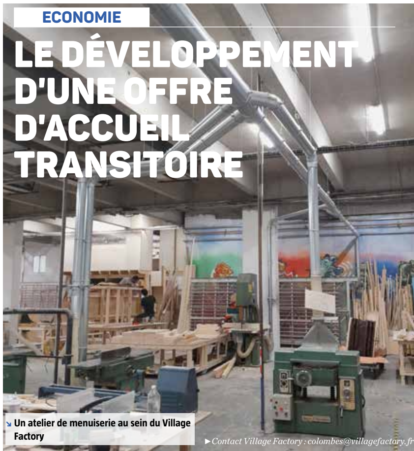
↳ Un atelier de menuiserie au sein du Village Factory

► Contact Village Factory : colombes@villagefactory.fr