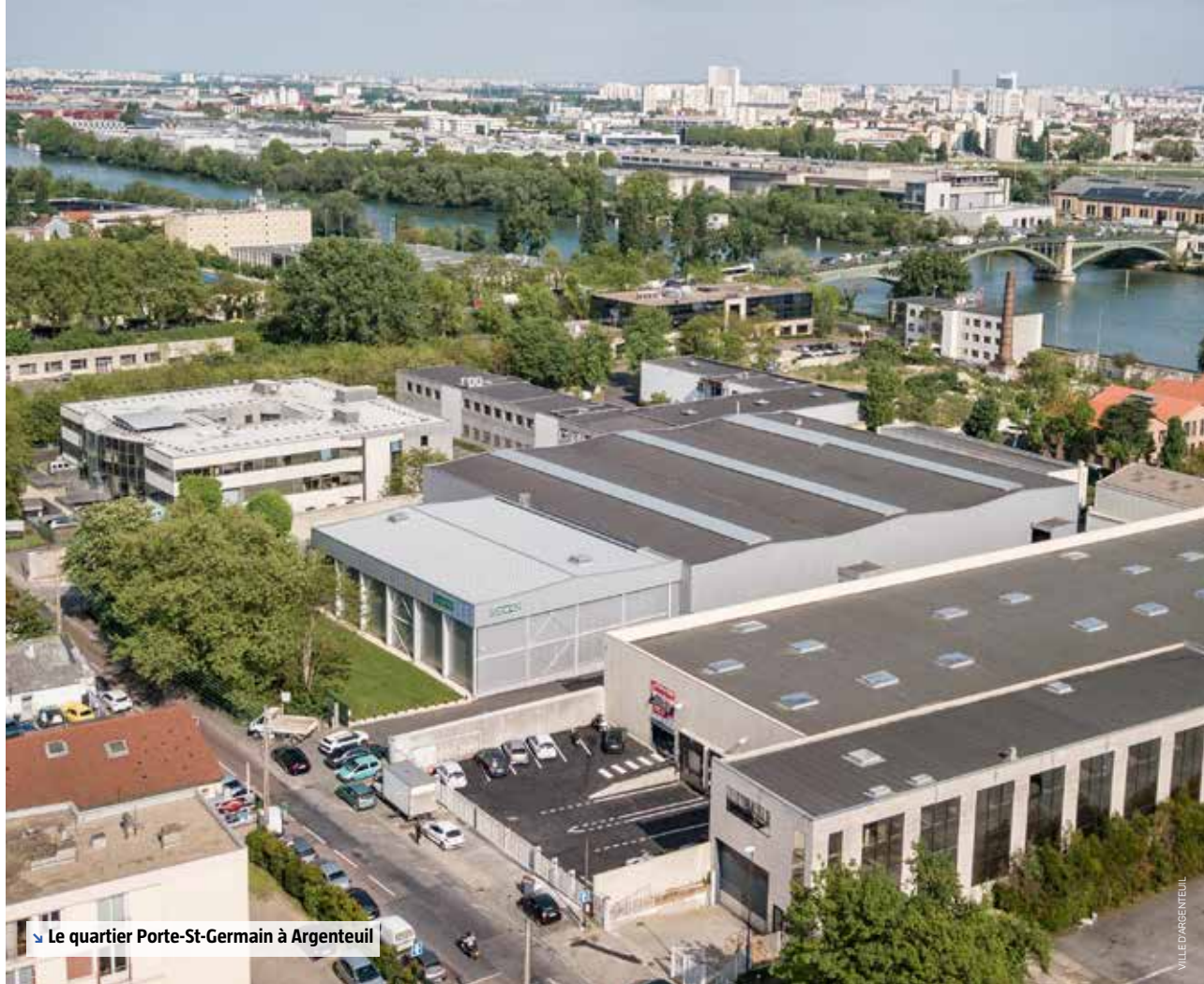
↳ Le quartier Porte-St-Germain à Argenteuil