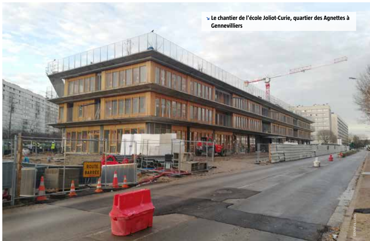
↳ Le chantier de l'école Joliot-Curie, quartier des Agnettes à Gennevilliers

Aujourd'hui, le quartier est monofonctionnel et composé uniquement de logements. L'objectif est avant tout d'accompagner le développement d'une nouvelle offre de logements, pour permettre plus de mixité, et d'améliorer l'habitat existant - pour offrir aux habitants du quartier un cadre de vie plus qualitatif. L'autre volet du projet consiste à rendre le quartier plus attractif : développement d'une offre de services et d'équipements en coeur de quartier, valorisation des espaces verts et désenclavement du quartier par une meilleure connexion aux transports en commun. 📍