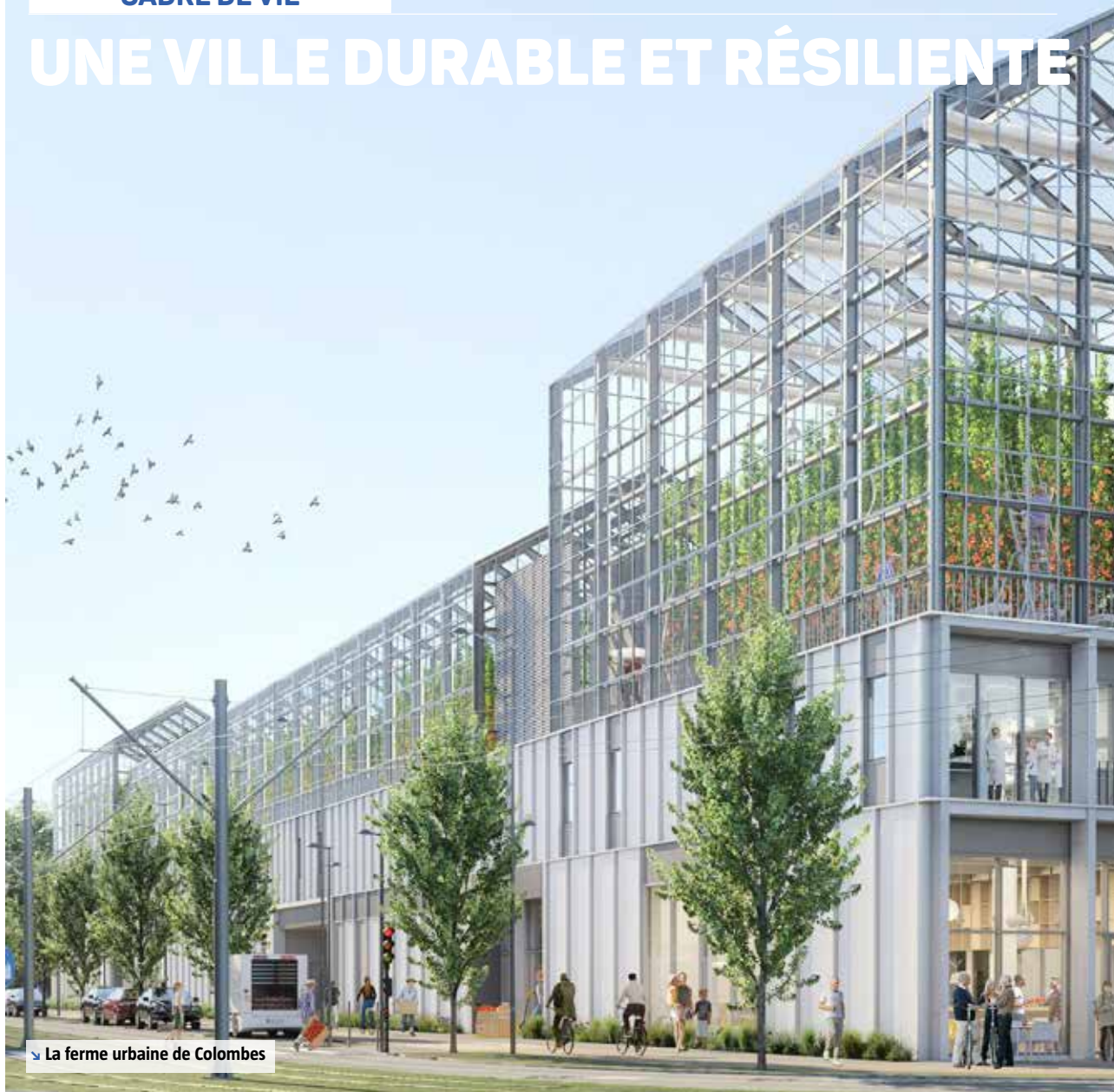
▼ La ferme urbaine de Colombes

Pour Boucle Nord de Seine, construire la ville de demain c'est avant tout construire une ville durable et résiliente, qui s'adapte aux nouveaux usages et aux enjeux climatiques. Une ville faite d'innovations, résolument tournée vers l'avenir.