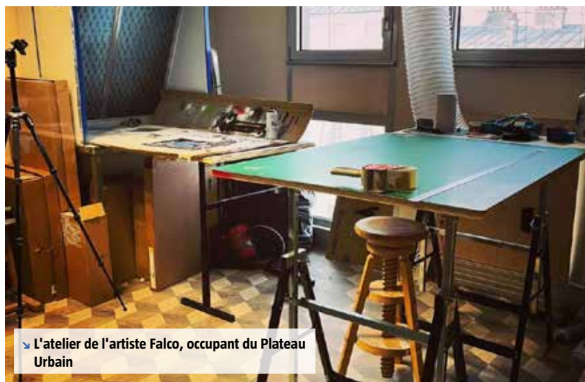
↳ L'atelier de l'artiste Falco, occupant du Plateau Urbain

années. De quoi répondre à la problématique d'accès à des espaces de travail adaptés tout en aidant les entreprises !