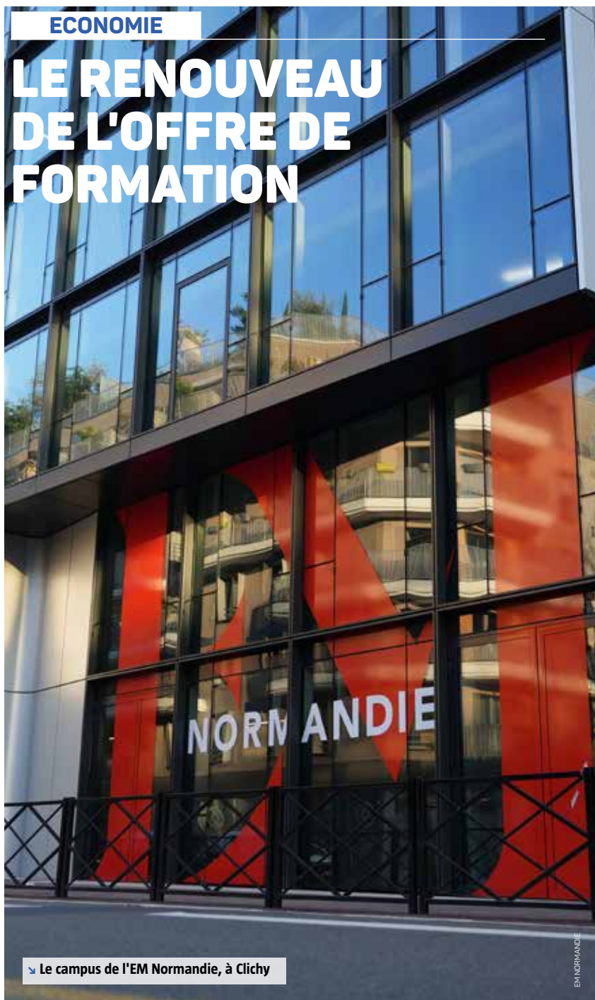
Le campus de l'EM Normandie, à Clichy