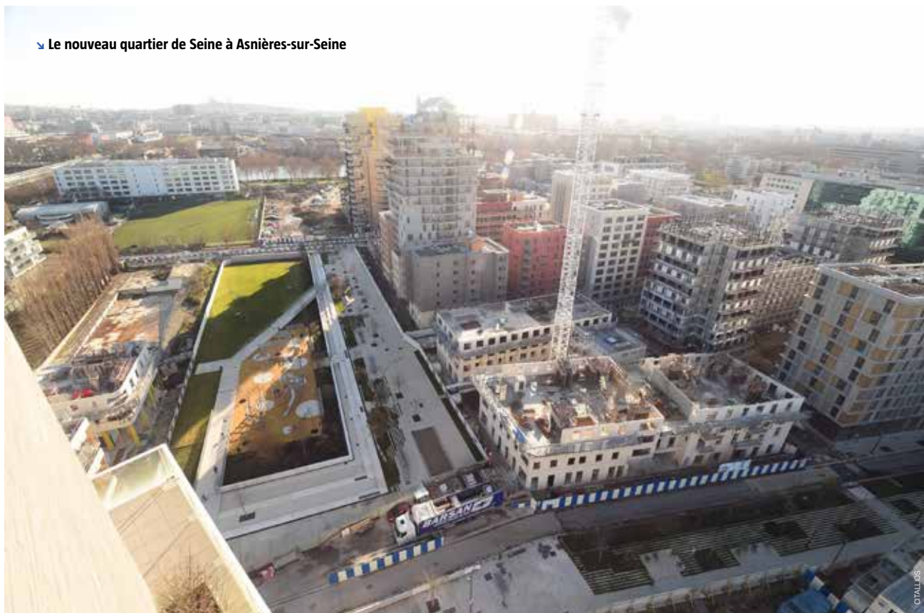
↳ Le nouveau quartier de Seine à Asnières-sur-Seine

Au nord-est de la ville, un second quartier va être aménagé grâce à la mutation d'un espace de 10 hectares qui accueillait précédemment principalement des activités. Ce futur quartier mixte proposera plus de 1 000 logements, des commerces de proximité, un groupe scolaire avec un gymnase et des espaces verts. La nature et les espaces piétons seront largement mis en avant pour assurer aux habitants du quartier un cadre de vie apaisé le long des berges de la Seine. Ainsi, ce ne sont pas moins de 14 000 m 2 de promenades piétonnes végétalisées qui sont prévues. À cela s'ajouteront de nombreuses plantations pour lutter contre le phénomène des îlots de chaleur et favoriser la perméabilité des sols. Ce nouveau quartier, qui sera intégré au reste de la ville et relié à la ligne 14 du métro, sera pensé pour être en continuité avec la ZAC des Docks de Saint-Ouen. ☉